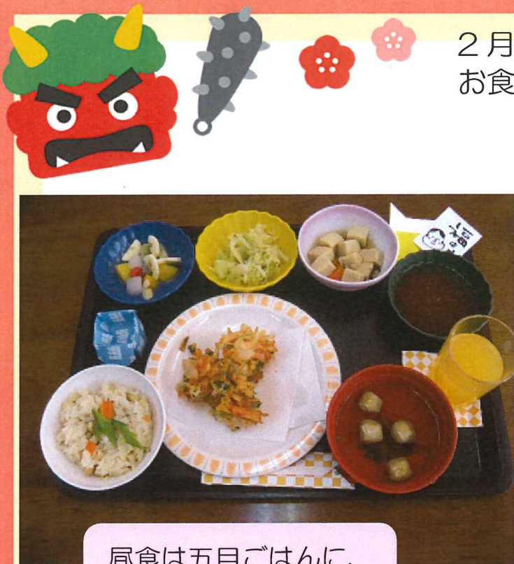
昼食は五目ごはん、かき揚げでした♪