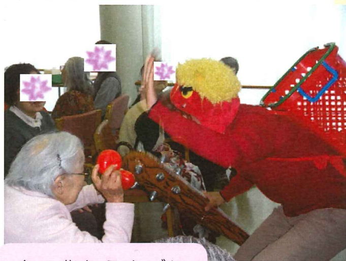
鬼の背負うカゴに入れられるかな？