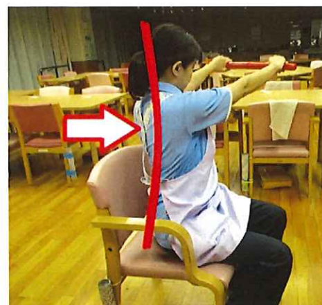
↑写真1「身体をねじる体操では背筋をまっすぐ伸ばすことがコツです」

実は、私たちが歩いているとき、身体は左右に8~10°程度、回旋しています。この回旋運動が無いと、私たちは歩くことができません。身体をねじる練習は、下肢を大きく振り出すことにつながる、歩行練習でもあるのです。