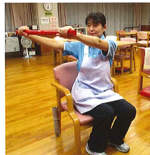
←写真2「目線は手の先に固定します」