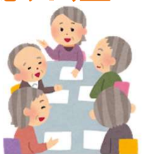
本人ミーティング