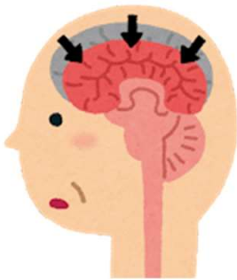
・アルツハイマー病