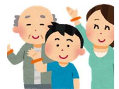
認知症サポーター養成講座 チームオレンジ