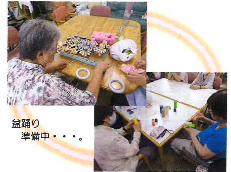
盆踊り準備中・・・

書道の時間を再開しています。ボランティア講師の方にご協力をいただき、お手本を作っていただきました。久しぶりの書を楽しむ時間。集中して書いていらっしゃいました。