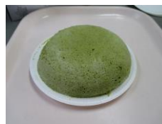
ホットケーキミックスに卵白を泡立てて、電子レンジでチン！