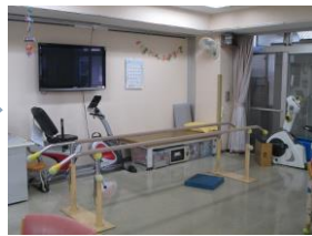
訓練スペースがゆったり！

★端午の節句はしょうぶ湯で「決まり！」でした。ゆっくりお湯につかり、疲れた筋肉をほぐします。