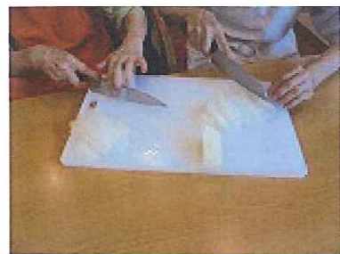
大根を千切りして

6月19・20・21日の3日間“料理教室”を行いました。さすが皆様、慣れた手つきで大根を切り、だしを取り、あっという間に美味しい味噌汁が出来上がりました。昼食のときに皆様でいただきました。お味もよく、おいしくいただきました。