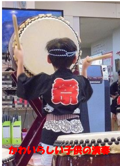
かわいらしい子供の演奏