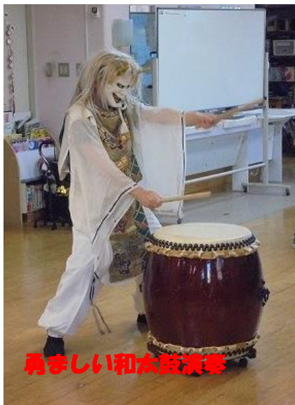
再々しい和太鼓演奏