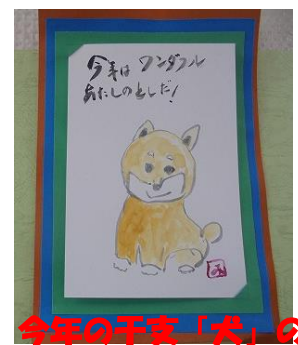
今年の干支「犬」の 絵手紙