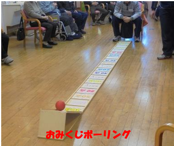
おみくじボーリング

1月は、新年会、初もうでなどお正月らしい活動で始まりました。新年会は、おみくじボーリングで初笑いをし、午後は太鼓の演奏を楽しみました。また、新年の祝い膳で新年を祝いました。