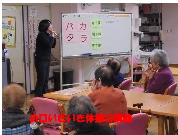
お口いきいき体操の講義

また、デイサービスセンターの中は3月の桃の節句に向けて、お雛様の作品がたくさん飾ってあります。