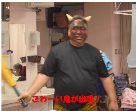
こわーい鬼が出現！

また、保健師さんに講師として来ていただき「お口いきいき体操」を一緒にしました。ひとつひとつの動きに効果があることを学びました。デイでも毎日食事前に実施しています。いつまでもおいしくお食事ができるよう継続していきます。