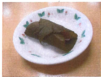
皮と桜の葉で巻いてできあがり！

今月のクイリング教室もひな祭りにちなんで、ひし餅と桃の花の作品を作りました。今年度新しく活動に加わったクイリングですが、皆様も慣れた手つきで作品を仕上げています。同じ材料を使って作品を作りますが、レイアウトや色使いに個性がにじみ出ます。