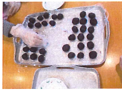
あんこを丸めます