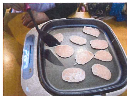
ホットプレートで皮を焼きます

午後には、みなさんで桜もちを作りました。ホットプレートで薄く桜色の皮を焼き、丸めたあんこを皮で包み、桜の葉の塩漬けを巻いたら出来上がり！かわいらしい桜もちを皆さんでいただきました。