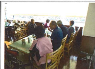
会話も弾み、笑顔がたくさん見られました。

11月は、練馬区役所 20階にある展望レストランへ“あんみつ”を食べに出かけてきました。天気に恵まれ練馬区役所 20階から、富士山、東京スカイツリー、新宿ビル群、横浜ランドマークタワーまで観ることができました。もちろん豊島園もよく見え「昔はよく遊びに行ったわ」「あの揺れる乗り物こわいわね」など、練馬の思い出話をたくさん聞くことができました。もちろん、展望レストランの“あんみつ”を美味しくいただきました。同じテーブルに座った方々同士で「おいしいわね、お腹いっぱい食べました」「また来年も来たいわ」「天気がよくてよかったわね」「景色を観るのもいいけど、“あんみつ”を食べることができてよかったわ、花より団子です(笑)」などなど、同世代の方々とたくさん交流する時間にもなりました。