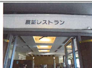
雰囲気もよく、丁寧な対応ありがとうございました。