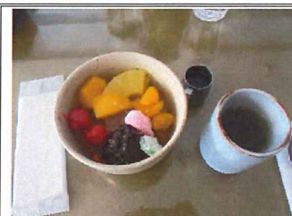
ボリューム満点、また行きましょう。ご馳走様でした。