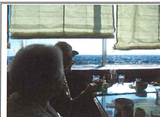
眺めのよい席で、お腹も心も満たされました。

外出行事には、外出を楽しむ目的以外にも重要な目的があります。それは、“機能訓練”を兼ねていることです。デイサービスセンターでの日ごろの運動成果を発揮し、段差に気をつけたり、区役所を訪れる一般の方々に注意して歩くことなど、実践での歩行訓練の効果も期待しました。