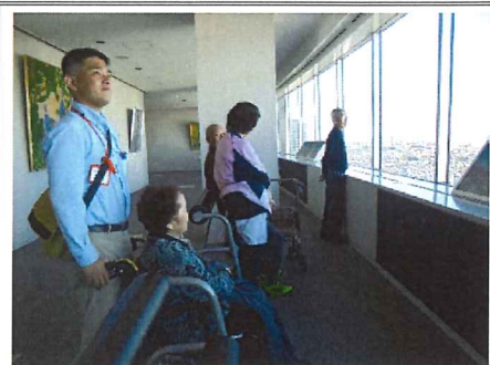
景色を眺めるために20階フロアを行ったり来たり、良い運動にもなりました。