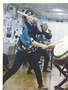
息の合った演奏 で、大盛り上がり