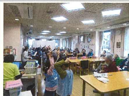
園児たちの元気な歌や披露、とても上手でした

1月は地域交流として近隣の“ひこばえ幼稚園”との異世代交流会も行いました。園児達がこの日のために練習してきてくれた歌と踊りの披露を観たり、一緒に活動を楽しむ時間もあったり、園児たちからたくさん元気をもらえる時間になりました。