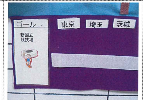
ゴールはここ新国立競技場。 真夏の東京で熱い戦いが始まります