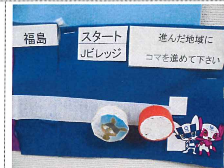
福島県を出発し、47都道府県を 聖火リレーがまわります