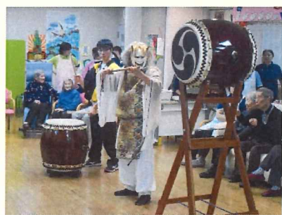
迫力ある太鼓のご披露！ 勢いに圧倒される場面でした

早速ではありますが、1月の取り組みについて記事にしてみました。毎年1月は新年会を行っていて、今年も“江戸っ子太鼓さん”による太鼓の披露がありました。迫力のある太鼓の披露や太鼓体験などを行い賑やかな新年会となりました。