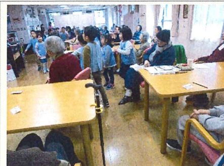
世代を超えた交流はお互いにとって貴重な時間になりました