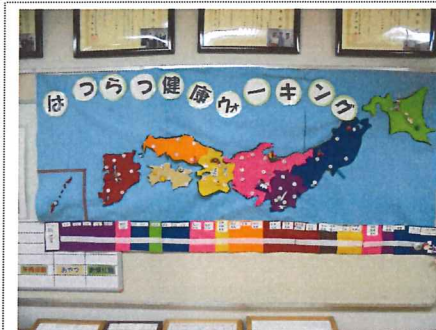
いよいよ聖火リレーのスタート です。目指せ東京!

富士見台デイサービスセンターの聖火リレーは東京オリンピックに先行してスタートします。目指せ東京オリンピック、一緒に頑張りましょう。