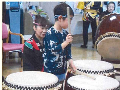
一生懸命太鼓を叩く様子、皆 様で見守り応援しました

1月は地域交流として近隣の“ひこばえ幼稚園”との異世代交流会も行いました。園児達がこの日のために練習してきてくれた歌と踊りの披露を観たり、一緒に活動を楽しむ時間もあったり、園児たちからたくさん元気をもらえる時間になりました。