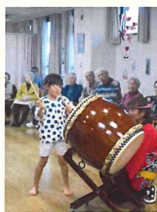
子供たちのご披露 もありました