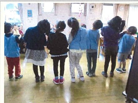
練習の成果を十分に発揮し、お客様を楽しませてくれました