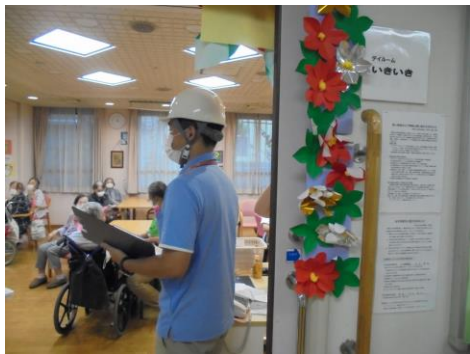
お客様〇〇名 職員〇〇名 計 〇〇名 安否確認と所在確認中の様子です。

富士見台デイでは、定期的に防災訓練を実施し、いざという時に備えております。8月28日