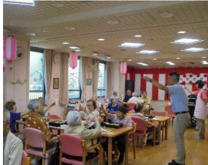
所長挨拶とカンパニー