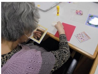
指先の技巧性等の維持向上を 効果効能として期待します