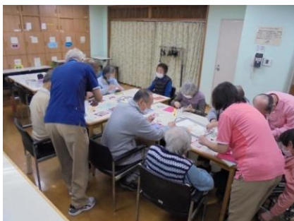
集中しながらも、皆様と交流 を楽しむ機会になりました