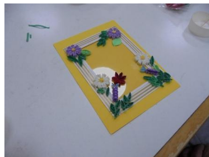
完成させることで達成感を得 て、次回への意欲を高めます