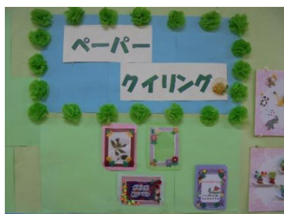
ペーパークイリング with コロナ 皆様の作品を展示しています

厳しい冬の到来が予想されますが、富士見台デイは感染拡大防止対策に取り組み、できる限り活動を継続していこうと思います。体調管理し、楽しみを持ってデイサービスへお越しください。