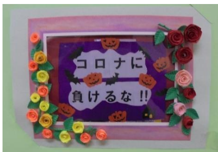
新型コロナウイルスの終息を 願う作品。これが皆様の思い!