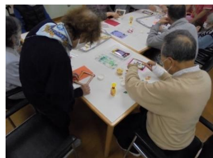
マスク越しでも集中している ご様子うかがえます