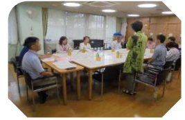
運営推進会議の様子

家族懇談会、運営推進会議、地域ケアセンター会議、ホームページなどを活用し、定期的に虐待防止の取り組み状況を公表しています。