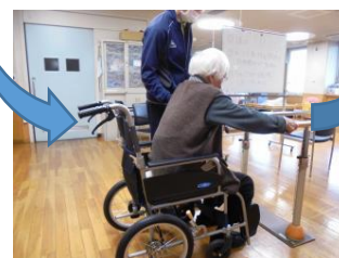
立ち座りを繰り返します