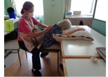
不安やストレスを和らげる効果があります