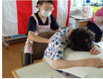
とてもリラックスされているようにでした

富士見台デイでは、新たな活動として『タクティールケア』を始めました。タクティールケアは、スウェーデンで誕生した、両手で優しく、ゆっくりと背中や手足に触れるケアです。不安やストレスを和らげるケアとして保健・医療・福祉の分野で幅広く活用されています。タクティールケアの当日は、アロマを使ってさらにリラックス効果を高めました。参加されたお客様がとても気持ちよさそうでした。富士見台デイのタクティールケアに参加し、リラックスしたひと時を過ごしませんか。今後、定期的に活動していきます。毎月配布している活動予定表に「●●さんのタクティール」とあれば、ぜひご参加ください。