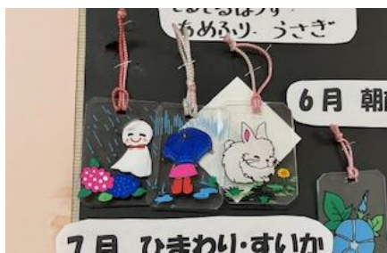
プラスチックアート