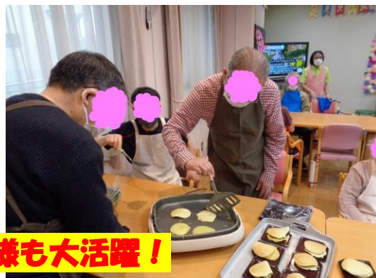
男性のお客様も大活躍！