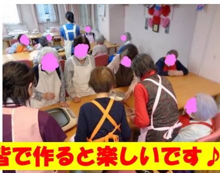
皆で作ると楽しいです♪