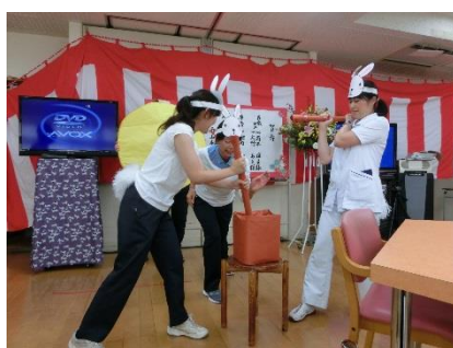
これは職員の出し物です