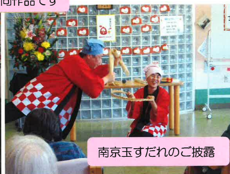
南京玉すだれのご披露