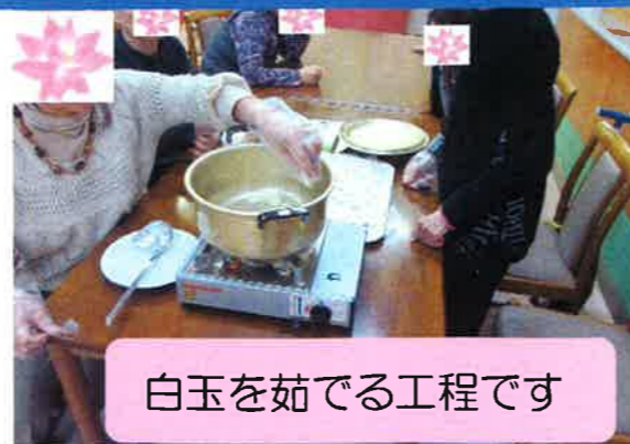
白玉を茹でる工程です