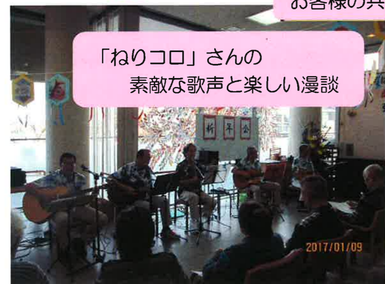
「ねりコロ」さんの 素敵な歌声と楽しい漫談