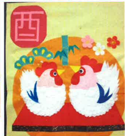
お客様の共同作品です