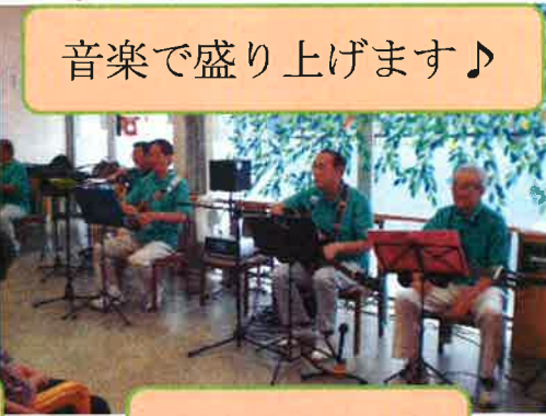
音楽で盛り上げます♪