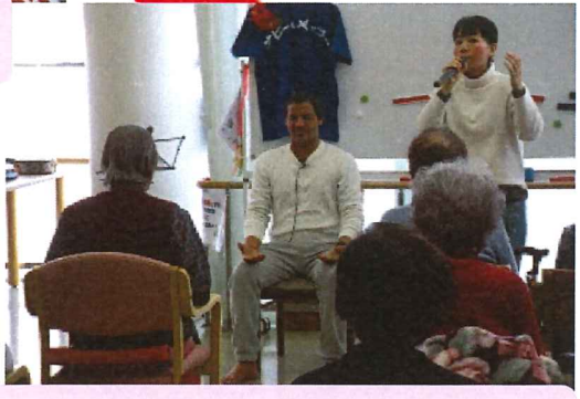
ヨガの先生も来られました！