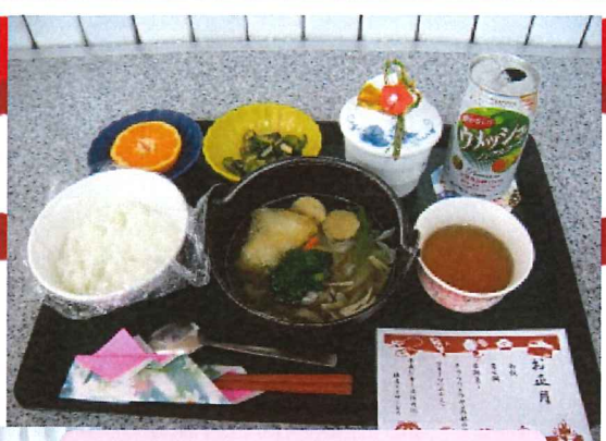
昼食は寄せ鍋でした♪