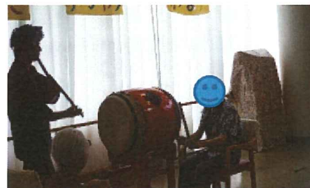
和太鼓の達人が登場！