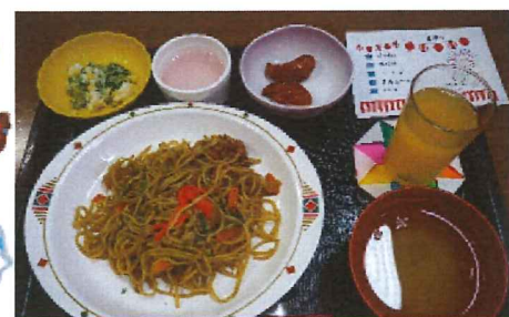
夏祭りには焼きそば！

練馬デイサービス恒例の夏まつりが、8月19日から21日にかけて今年も盛大に行われました。スイカ割りやヨーヨー釣り、射的ゲーム、輪投げ、盆踊りを楽しんで頂きました！