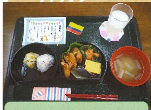
定番のおにぎり弁当！