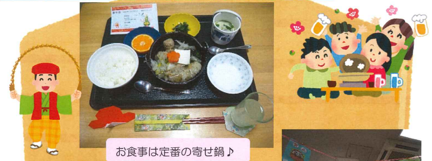
お食事は定番の寄せ鍋♪