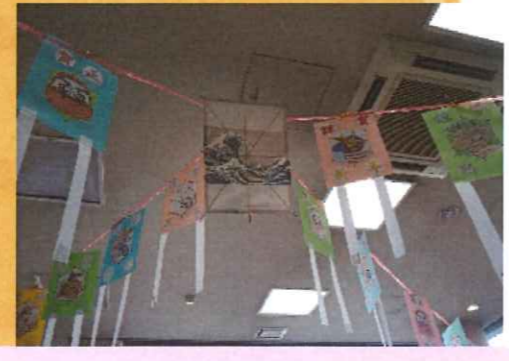
手作り凧が宙を舞います！