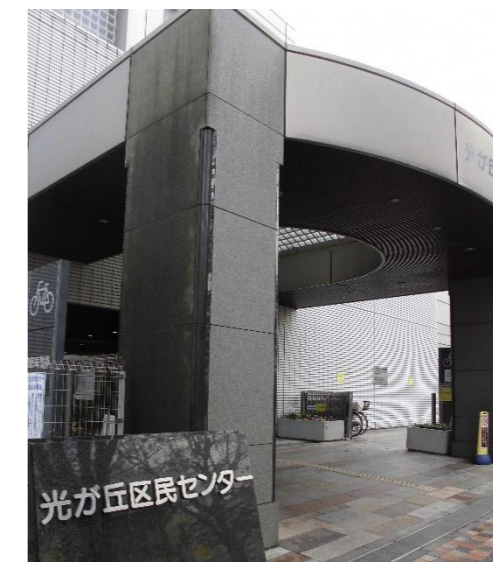
光が丘区民センター