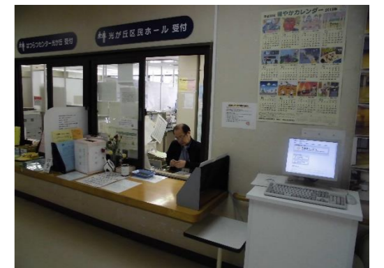
受付窓口、利用者用端末機(3階)