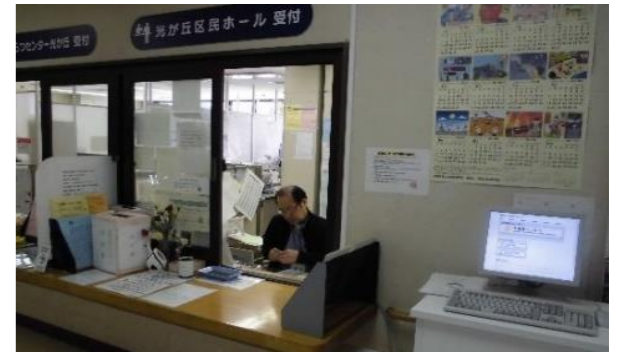
受付窓口、利用者用端末機（3階）