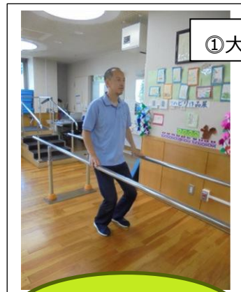
①大腿四頭筋の筋トレ