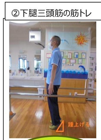
②下腿三頭筋の筋トレ