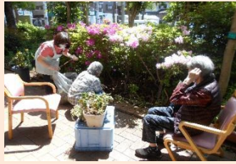
↑草むしりと日光浴*