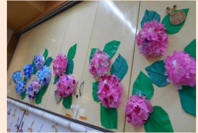
↑皆様が作った紫陽花です

※限られた職員数の為、お待たせしてしまうこともありますが、少しでも多くのお客様が自由に楽しめるように、取り組んでおります。