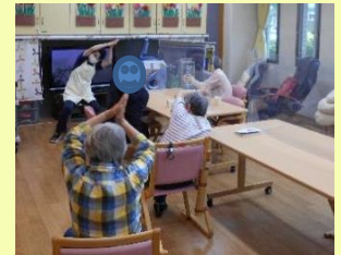
↑毎日の体操の様子