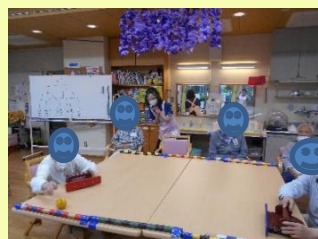
↑テーブルホッケー