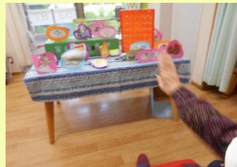
↑端午の節句「柏餅投げゲーム」