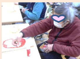
節分の鬼を貼り絵で作っています