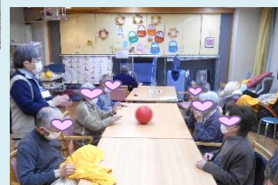
ボール転がしゲーム