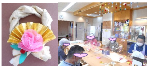
正月飾りを作りました