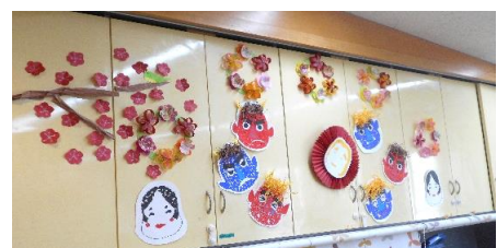
節分の飾りを皆さんで作りました 良い春が来ますように