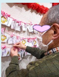
絵馬に願いを書いて初詣 &おみくじ