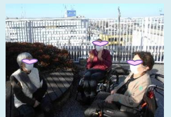
青空が 気持ちいいです