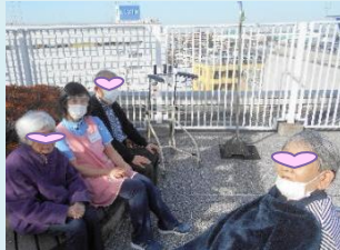
本日も晴天なり 屋上で外気浴

1人では何をしたらいいかわからない。一緒だとなんだか楽しい 「活気の輪」に入ると元気をもらえますよ♪