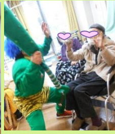
日本の伝統行事です 鬼退治できましたね😊