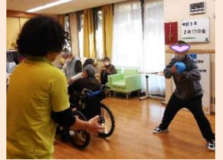
個別でキャッチボール! 運動機能が抜群です