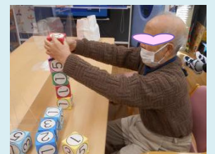
積み上げゲームで 集中力をアップ!