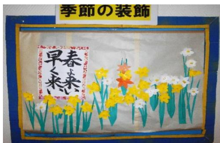
皆さんで 作った 水仙と福寿草