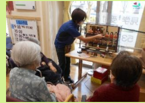
お雛様の 準備中です