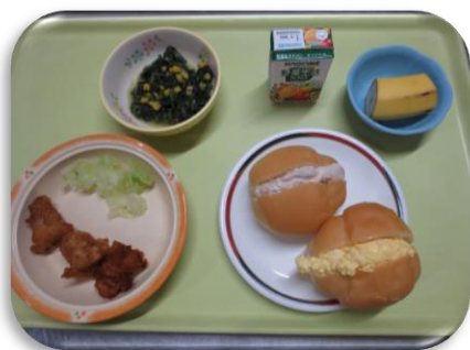
【卵サンドメニュー】