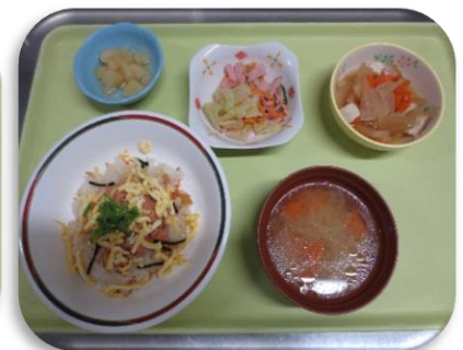
【ちらし寿司メニュー】