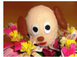
「発犬君」 田柄デイサービスセンター マスコット