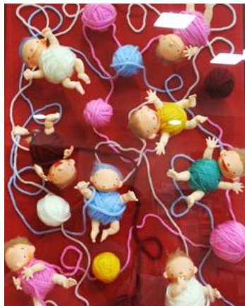
「毛糸玉コロコロ」作：ごとうゆき