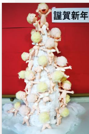
「お日様へ」作:ごとうゆき

今できることは精一杯取り組み、一日も早く感染症を克服できるよう組織をあげて取り組みを進めていきます。