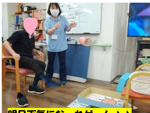
明日天気にな～れゲーム♪♪