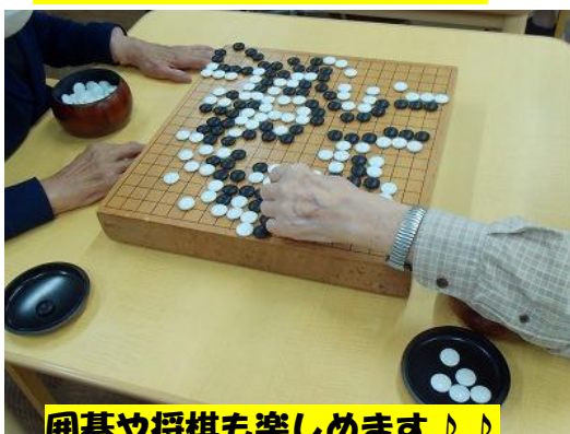
囲碁や将棋も楽しめます♪♪

～高松デイサービスからのお願い～ 負担割合証の更新の時期になりました。 負担割合が変更になられるお客様がおられましたら、お電話又は連絡帳にてお知らせ ください。宜しくお願い申し上げます。