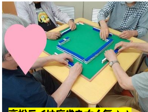
高松デイは麻雀も大人気♪♪