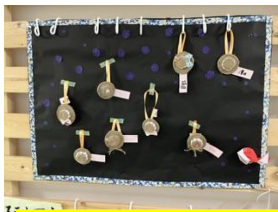
乾くまで飾らせて頂きました♪