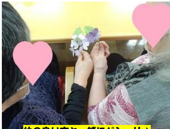
仲の良い方と一緒にパシャリ♪