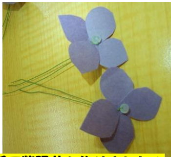
和紙で紫陽花を作りました♪