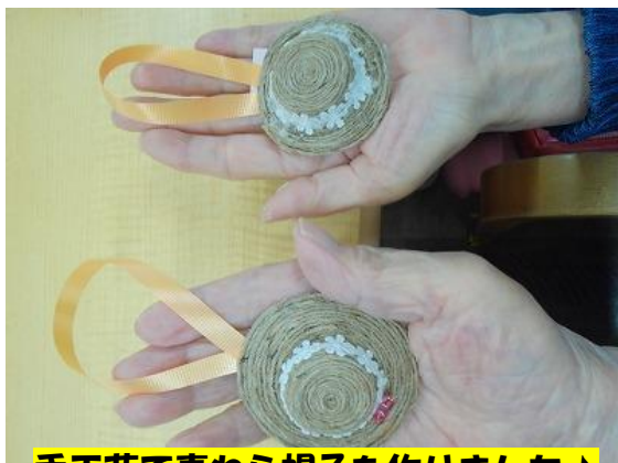
手工芸で麦わら帽子を作りました♪