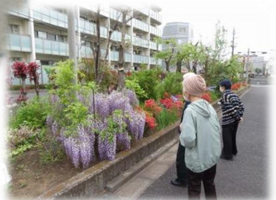
歩行訓練を兼ねて近隣に 「春探し」 に出かけました。