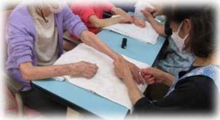
人気のハンドトリートメントさん デイルームはいい匂いに包まれました