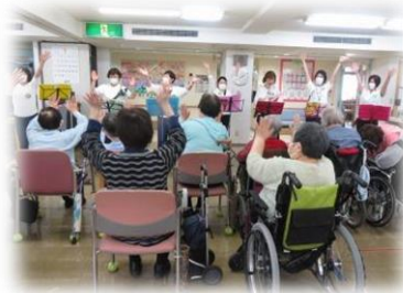
初めてのボランティアです ウクレレサンデーさん 音楽に合わせて体が動きます