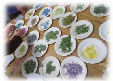
押し花で素敵なしおりを作りました