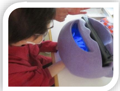
手洗いモンスター