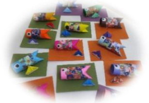
鯉のぼり カーネーション作成