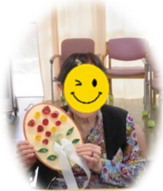
バラの壁飾り作り